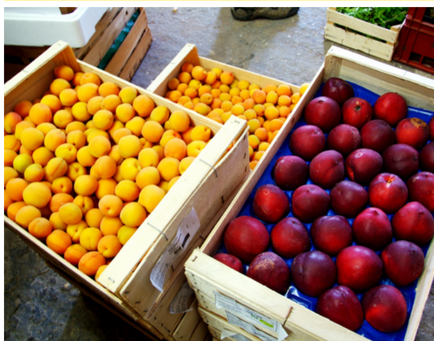
Edition Avril 2020